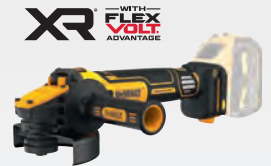
DCG 409 VSNT dwdcg409vsnt-xj