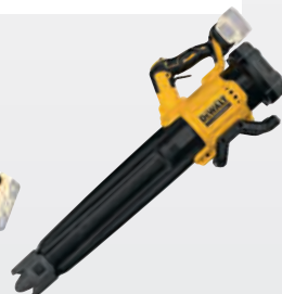
DCMBL 562 N** dwdcmbl562n-xj