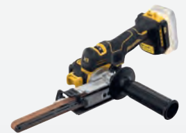
DCM 200 NT dwdcm200nt-xj