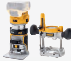
DCW 604 NT dwdcw604nt-xj