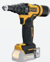
DCF 403 NT dwdcf403nt-xj