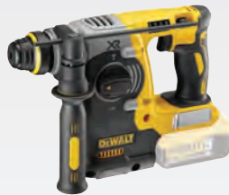
DCH 273 NT 24.1108.4959