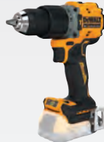
DCD 805 NT dwdcd805nt-xj