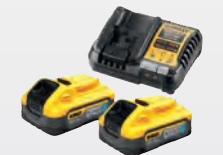
2 x 5,0 Ah Ah POWERSTACK / DCB 1104 ** dwdcb1104h2-qw