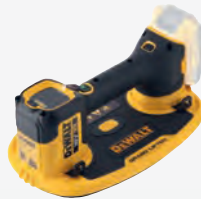
DCE 590 N ** dwdce590n-xj