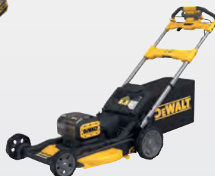
DCMWSP 156 N ** dwdcmwsp156n-xj