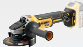
DCG 405 NT 24.5102.4960