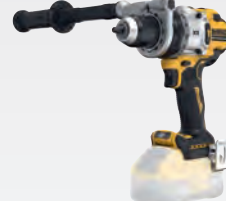
DCD 1007 NT dwdcd1007nt-xj