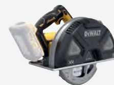
DCS 383 N** dwdcs383n-xj