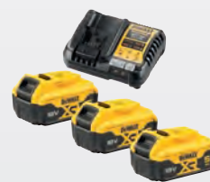
3 x 5,0 Ah / DCB 1104 ** dwdcb1104p3-qw