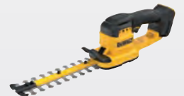
DCMHT 520 N** dwdcmht520n-xj