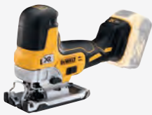
DCS 335 NT 24.3728.4961