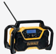
DCR 029 ** dwdcr029-qw