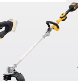
DCMST 561 N dwdcmst561n-xj