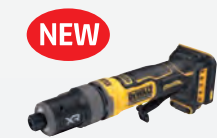
DCG 420 N ** dwdcg420n-xj