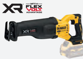
DCS 386 NT dwdcs386nt-xj