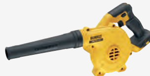
DCV 100 ** 25.8118.0100