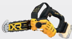
DCMPS 520 N** dwdcmps520n-xj