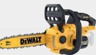
DCMCS 565 N** dwdcmcs565n-xj