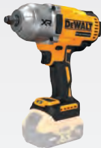
DCF 900 NT dwdcf900nt-xj