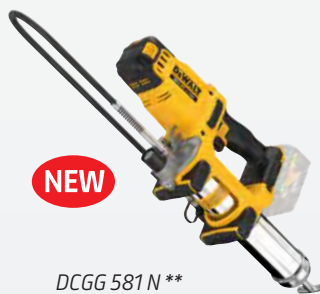
DCGG 581 N ** dwdcgg581n-xj