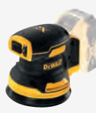
DCW 210 NT dwdcw210nt-xj