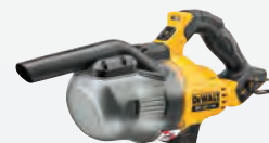
DCV 501 LN HEPA ** dwdcv501ln-xj