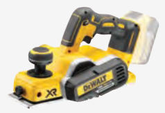
DCP 580 NT 24.3198.4959