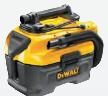
DCV 584 L ** 25.8111.7300