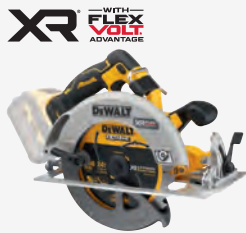
DCS 573 NT dwdcs573nt-xj