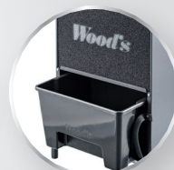
Filter, einfach zu reinigen Wassertank