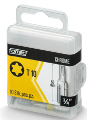
Verpackung Bits 25 + 50 mm