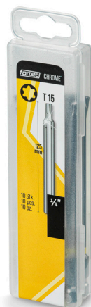
Verpackung Bits 125 mm