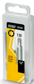
Verpackung Bits 75 mm